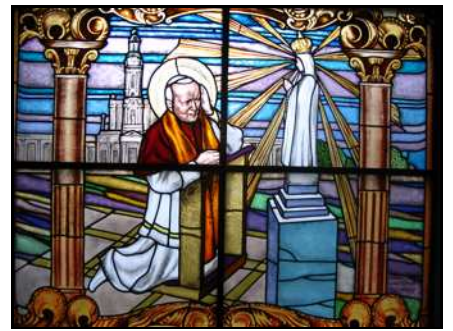
Jeden z nowych witraży