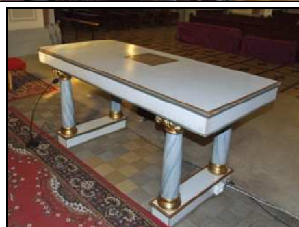
Ołtarz przed remontem prezbiterium