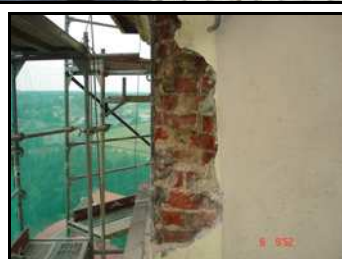
Tak było ...