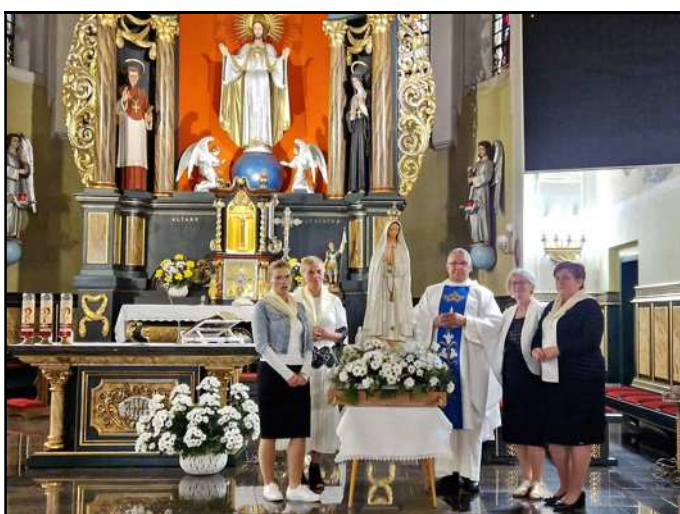
Czerwcowe Nabożeństwo Fatimskie