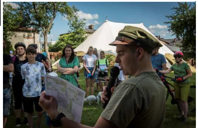
Gra miejska, rodzinna "Migawki z Boguszowic"