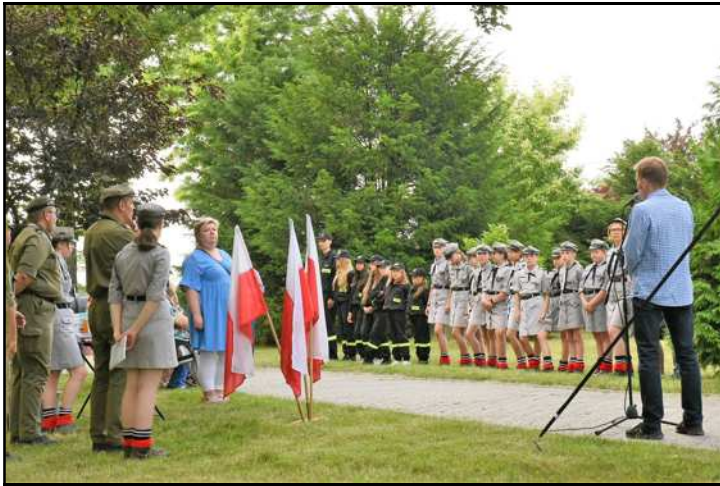
Otwarcie wystawy "Bramy do Polski"