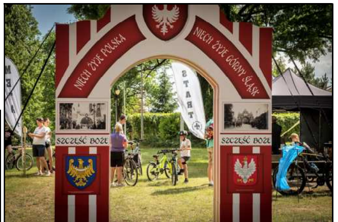
Replika bramy powitalnej z okresu Powstań Śląskich