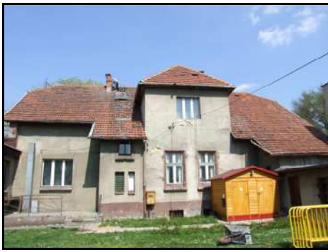
Stare probostwo przed remontem