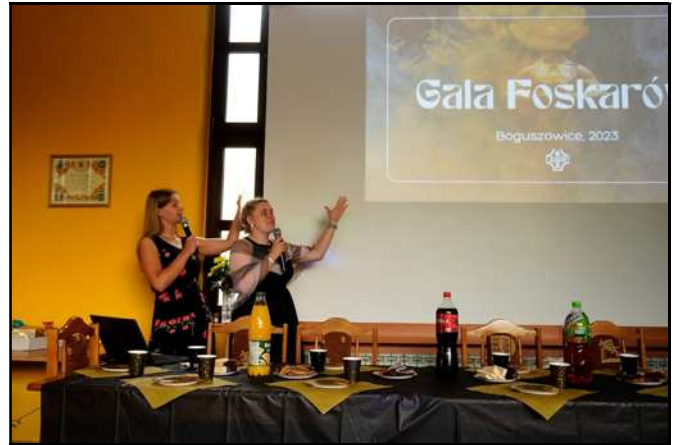
Spotkanie w Domu Parafialnym