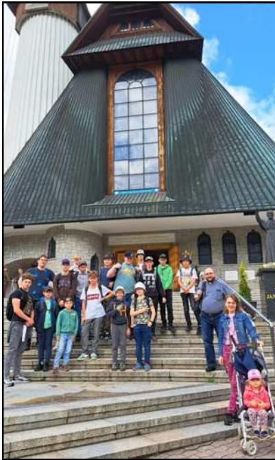
Przed kościołem na Krzeptówkach