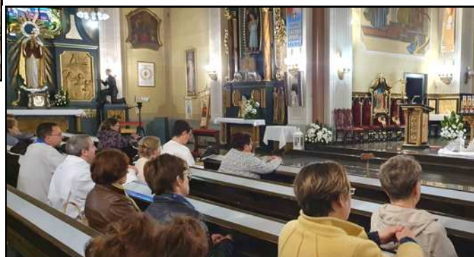
Modlitwa różańcowa podczas majowego Nabożeństwa Fatimskiego

13 maja odprawiliśmy pierwsze w tym roku Nabożeństwo Fatimskie, które rozpoczęło cykl nabożeństw aż do 13-go października. Zgodnie z zachętą Matki Bożej w czasie Objawień Fatimskich w roku 1917, trwamy na nieustannej modlitwie o dar pokoju w Europie i na świecie.