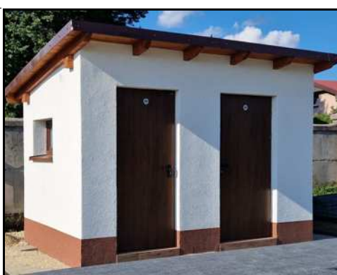
Nowe toalety na cmentarzu

O dokonaniach na polu gospodarczym w czasie ostatnich miesięcy — czytaj str. 5 – 7