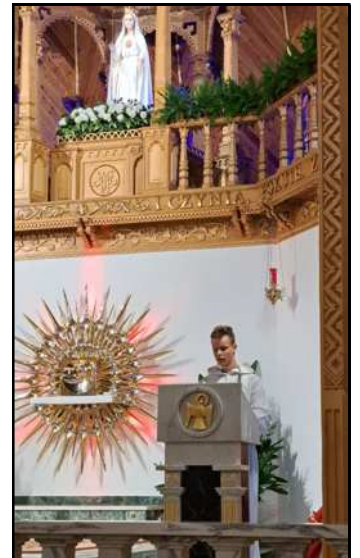
Msza św. na Krzeptówkach