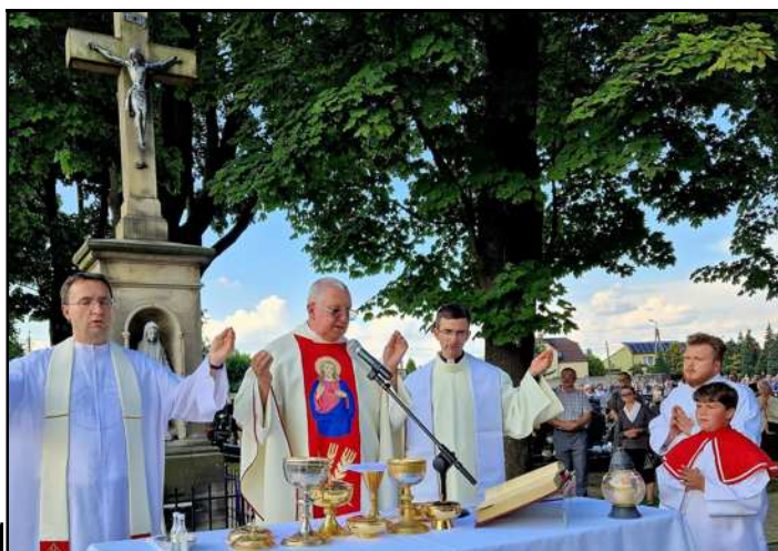
Msza św. na cmentarzu