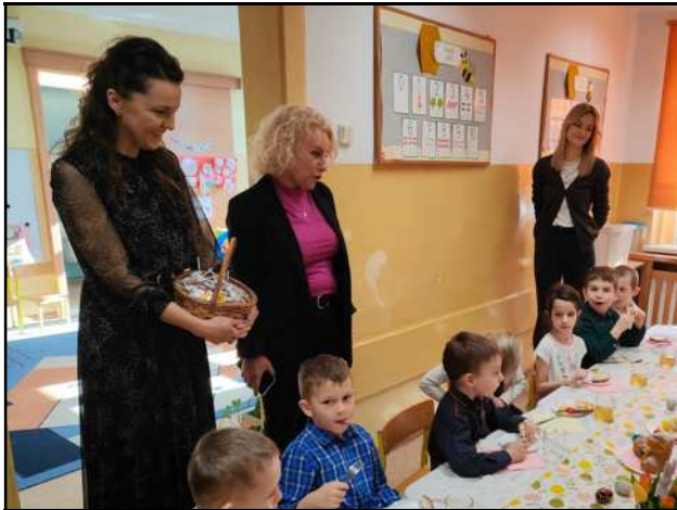
Składanie życzeń przez Dyрекcję P 18