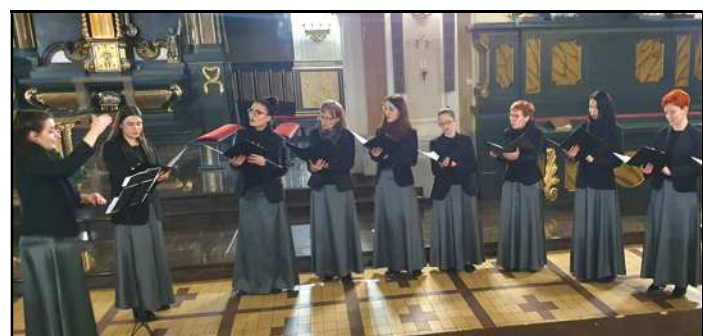
Pieśni pasyjne w Wielki Piątek