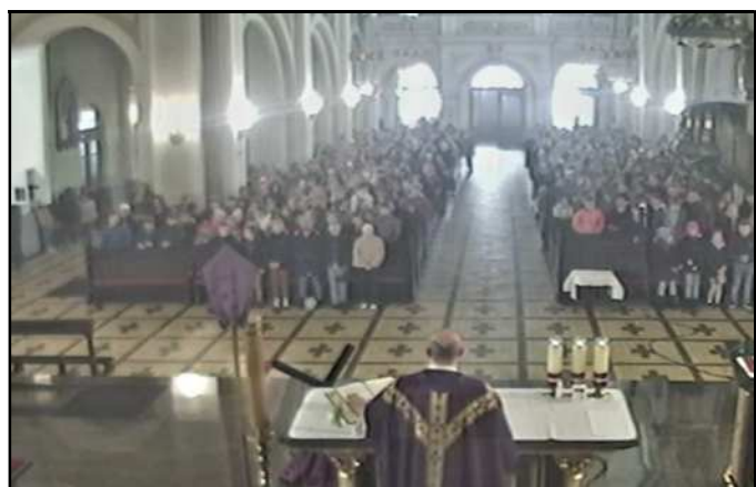
Msza św. na zakończenie rekolekcji