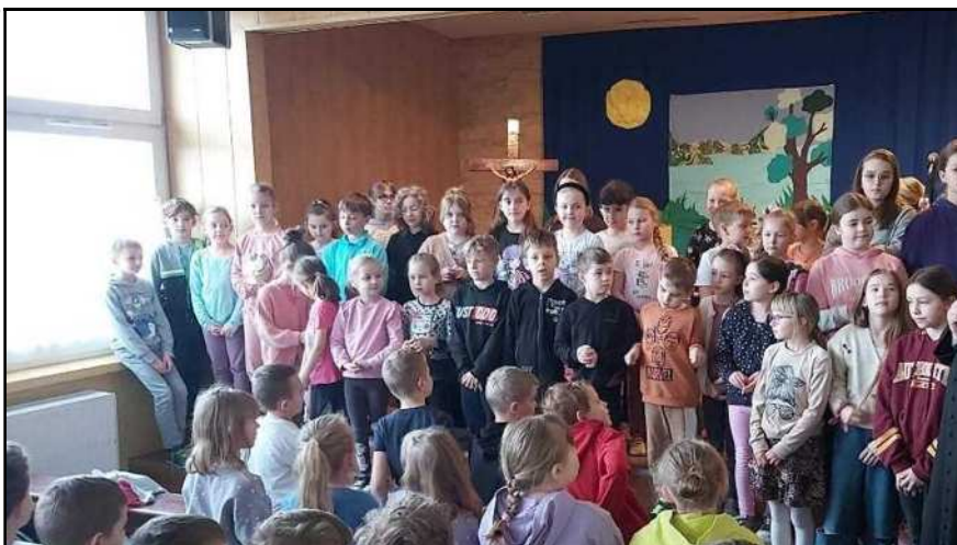
Spotkania rekolekcyjne w SP 20 w Gotartowicach