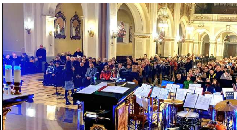
Noworoczny Koncert Kolęd i Pastorałek