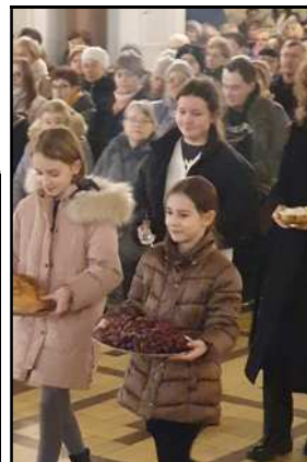
Procesja z darami