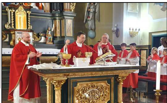
Komunia Św. w Wielki Piątek