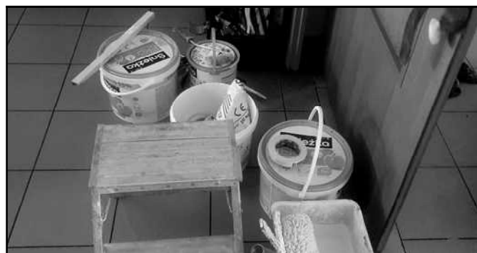
Malowanie głównej części probostwa