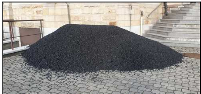
Uzupełnienie zapasów ekogroszku