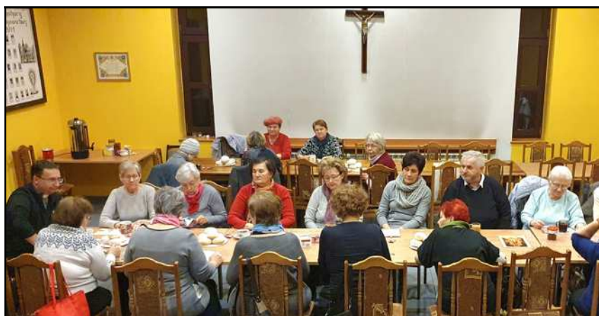
Lutowe spotkanie formacyjne Grupy Pielgrzym