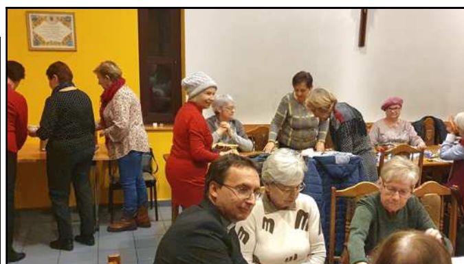
Noworoczne spotkanie Grupy Pielgrzym