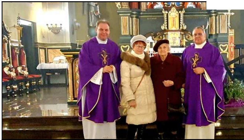
Dostojna Jubilatka po Eucharystii