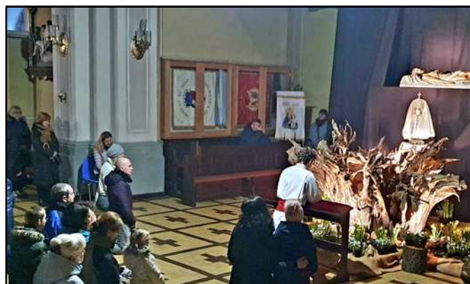
Adoracja Pana Jezusa w Bożym Grobie

W Wielką Sobotę adorowaliśmy Najświętszy Sakrament złożony w Grobie Pańskim. Tradycyjnie również święciliśmy pokarmy na stół wielkanocny. Zaś najważniejszym wydarzeniem zbawczego roku liturgicznego była liturgia Wigilii Paschalnej.