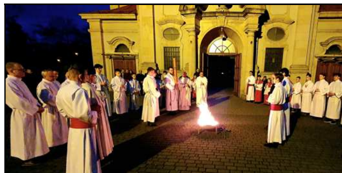
Poświęcenie ognia i Paschału w Wielką Sobotę