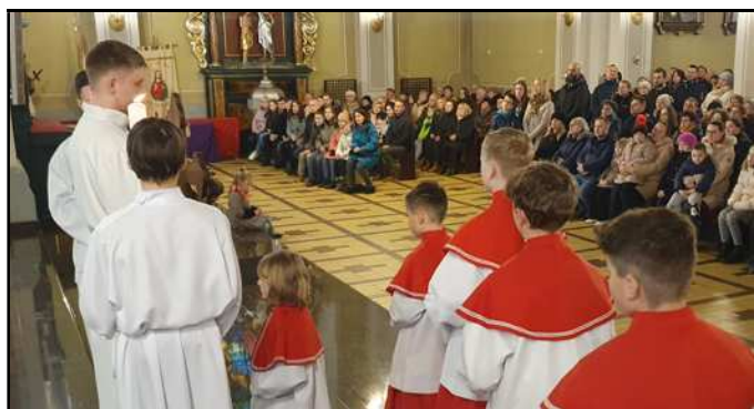
Adoracja Krzyża w Wielki Piątek