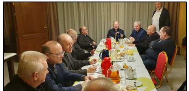
Spotkanie przy stole