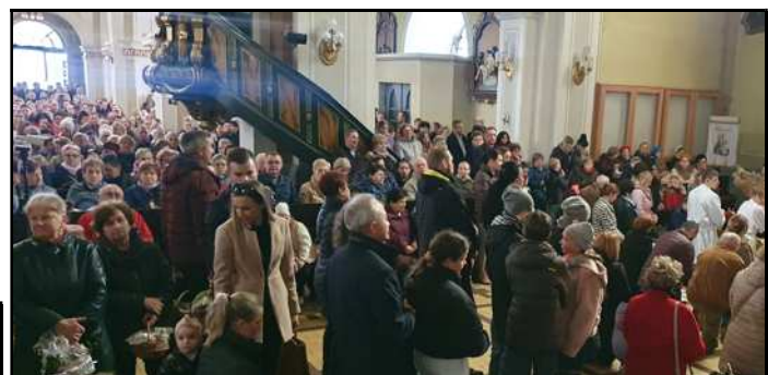
Święcenie pokarmów w Wielką Sobotę