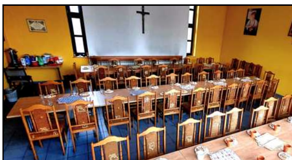
W ramach rekolekcji odbyła się Eucharystia dla chorych, po której zaproszono ich na spotkanie do Domu Parafialnego