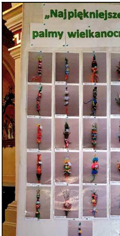
Konkurs na najpiękniejszą palmę wielkanocną zorganizowany przez Przedszkole nr 50 w Boguszowicach