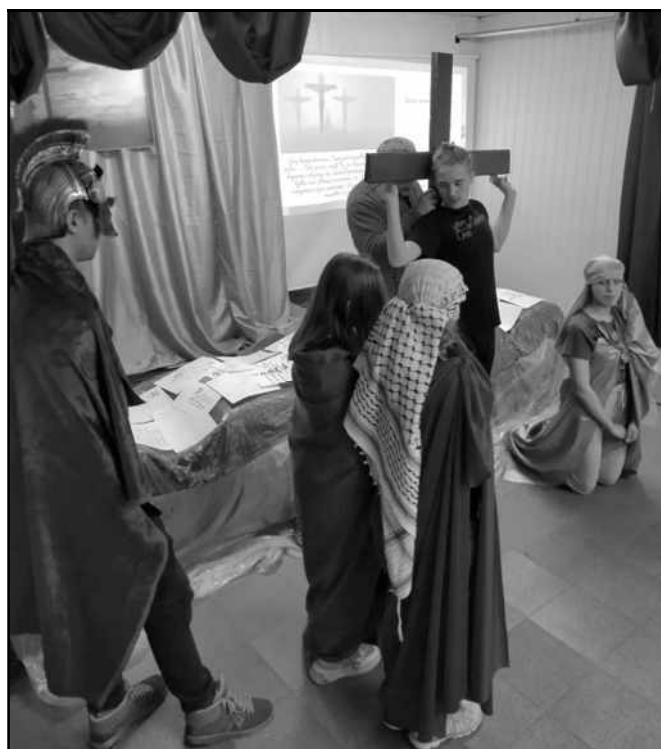
Rekolekcje Wielkopostne w ZS nr 6 w Boguszowicach