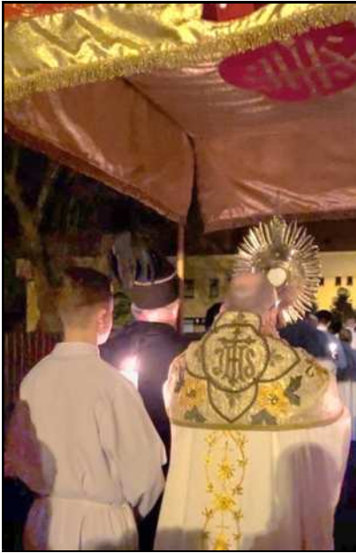
Procesja Rezurekcyjna w Wielką Sobotę