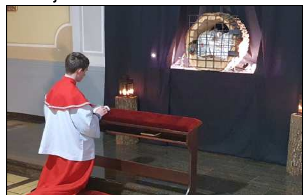
Adoracja Pana Jezusa w ciemnicy

W Wielki Piątek celebrowaliśmy zbawczą śmierć Chrystusa na krzyżu.