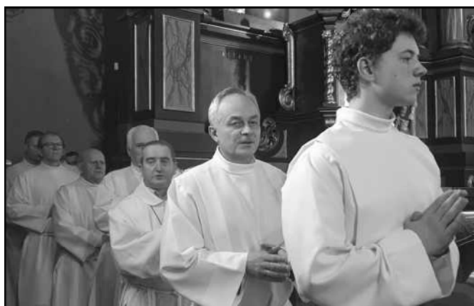
Nasi szafarze nadzwyczajni Komunii Świętej, podczas wielkopiątkowej adoracji Krzyża