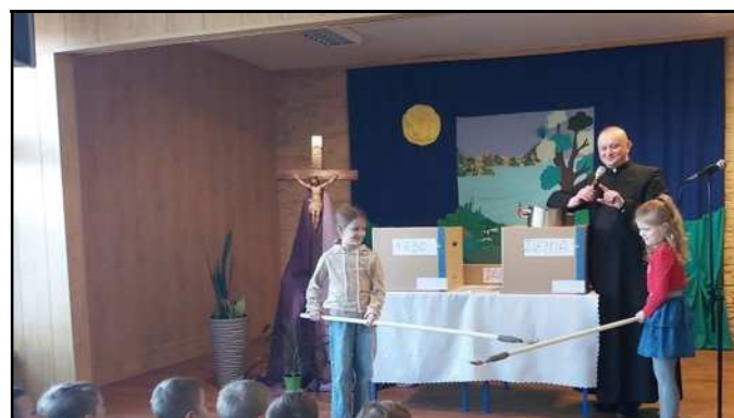
Rekolekcje w SP 20 w Gotartowicach