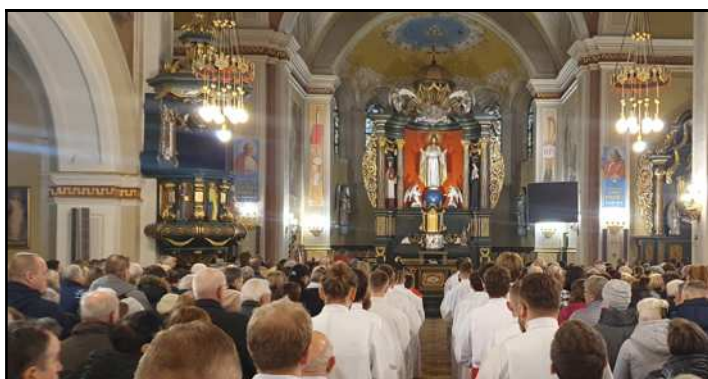
Procesja na wejście w Wielki Piątek