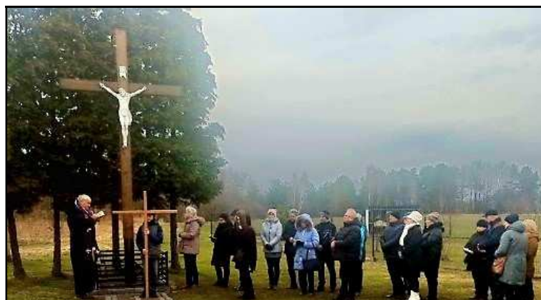
Droga Krzyżowa ulicami Boguszowic w ramach rekolekcji