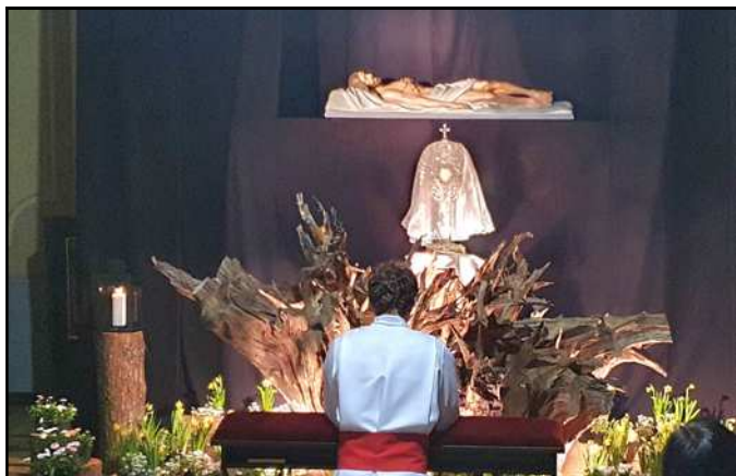
Adoracja Pana Jezusa w Bożym Grobie