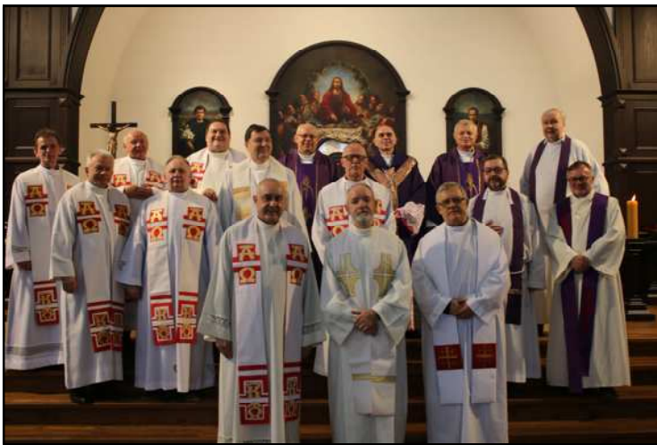
Kapłani rocznika święceń 1986