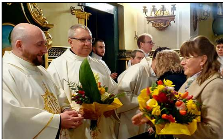
Życzenia kapłanom z okazji ich święta złożyli przedstawiciele Rady Parafialnej