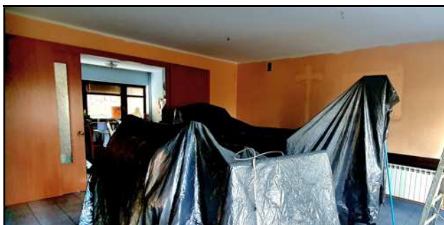
Pomalowania na terenie Nowego Domu Parafialnego głównej części probostwa