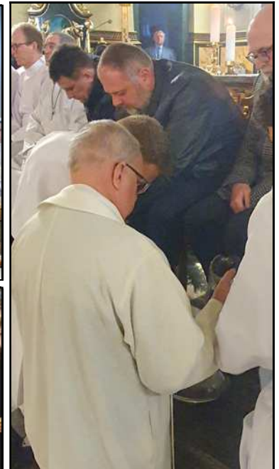
Obrzęd umycia nóg