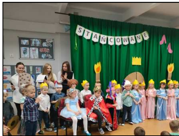
Przedstawienie w wykonaniu gr. Misie z P18