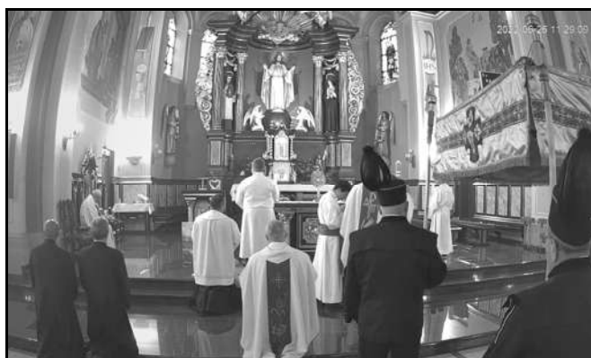
Uroczysta suma odpustowa

W trybie wyjątkowym dzieci naszej parafii przyjmowały przez ostatnie 2 lata Pierwszą Komunię Świętą . Prawie wszystkie rodziny komunijne przeżyły już swoją uroczystość we wcześniej wybranym terminie. W latach następnych, jak Bóg pozwoli, Pierwsze Komunie Święte odbywać się będą według ustalonego planu. W poszczególne niedziele maja, zaczynając od pierwszej, będą następujące grupy dzieci: I niedziela – SP 20 Gotartowice, II niedziela – ZSzP nr 6 (SP 16) Boguszowice i III niedziela SP 36 Boguszowice. W IV niedzielę te rodziny, którym termin wcześniejszy nie odpowiada. Msza św. komunijna będzie odprawiana o godz. 11.30 zaś nieszpory o godz. 17.30.