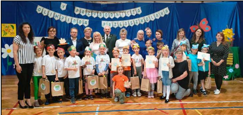
Olimpiada Przyrodnicza Przedszkolaków