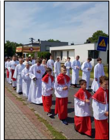
Tegoroczna uroczystość Bożego Ciała przebiegała przy wspaniałej pogodzie