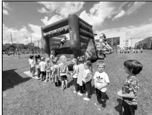
Największa atrakcja tegorocznego Dnia Dziecka

Z ogromną radością świętowaliśmy tegoroczny Dzień Rodziny, skąd taka euforia? Dokładnie stąd, że Mamusie i Tatusiowie uczestniczyli w uroczystości przedszkolnej. Nasze przestronne sale swobodnie pomieściły wszystkich gości. Dzieci odważnie przekazywały najlepsze życzenia