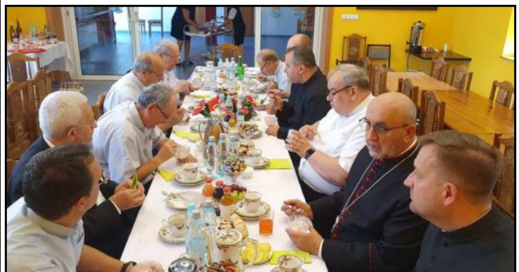
Spotkanie kapłanów przy stole po sumie odpustowej