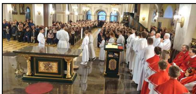
Adoracja Krzyża w Wielki Piątek