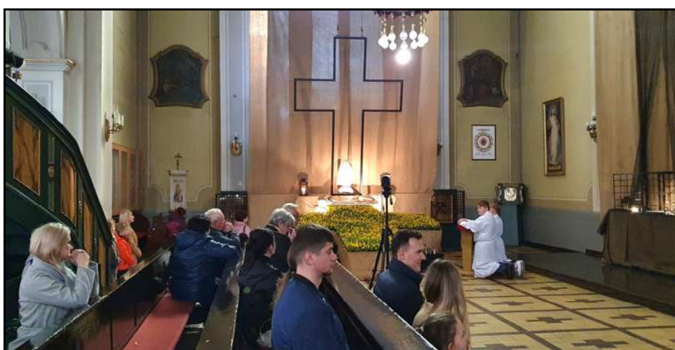
Adoracja Najświętszego Sakramentu złożonego w Grobie Pańskim