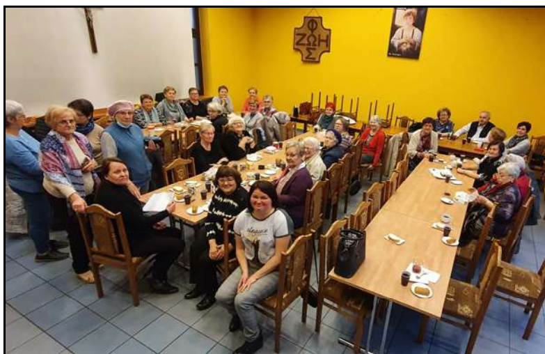
Spotkanie formacyjne Grupy Pielgrzym