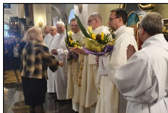
W Wielki Czwartek obchodzimy pamiętkę ustanowienia Eucharystii oraz sakramentu kapłaństwa