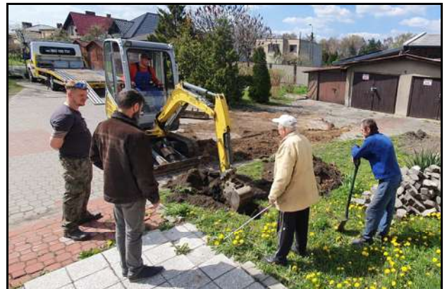
Remont kanalizacji na Starej Farze