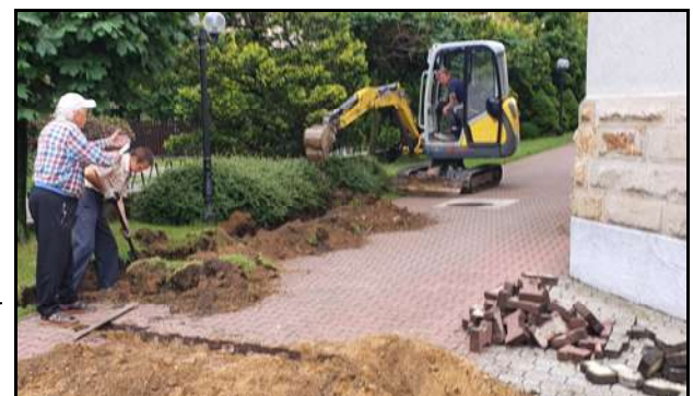
Poprowadzenie instalacji wodnej wokół kościoła

„Serce Ewangelii” miesięcznik parafii pw. Najświętszego Serca Pana Jezusa w Rybniku – Boguszowicach + Redaktor prowadzący: