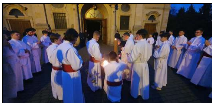
Kapłan zapala paschał od poświęconego ognia