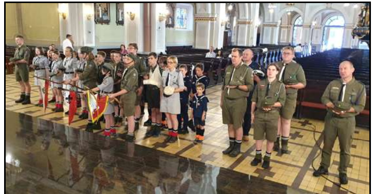
Organizatorem Festiwalu było m. in. Boguszowickie Stowarzyszenie Społeczno-Kulturalne „Ślady”