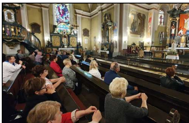
Modlitwa różańcowa podczas majowego Nabożeństwa Fatimskiego

13 maja odprawiliśmy pierwsze w tym roku Nabożeństwo Fatimskie, które rozpoczęło cykl nabożeństw aż do 13-go października. Zgodnie z zachętą Matki Bożej w czasie Objawień Fatimskich w roku 1917, trwamy na nieustannej modlitwie o dar pokoju w Europie i na świecie.