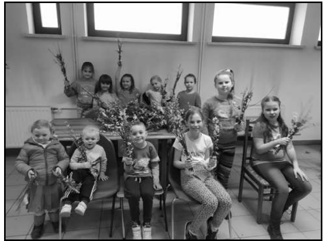
Przygotowanie palm wielkanocnych

Dziękujemy serdecznie parafianom za ofiarę złożoną podczas sprzedaży palm wielkanocnych,