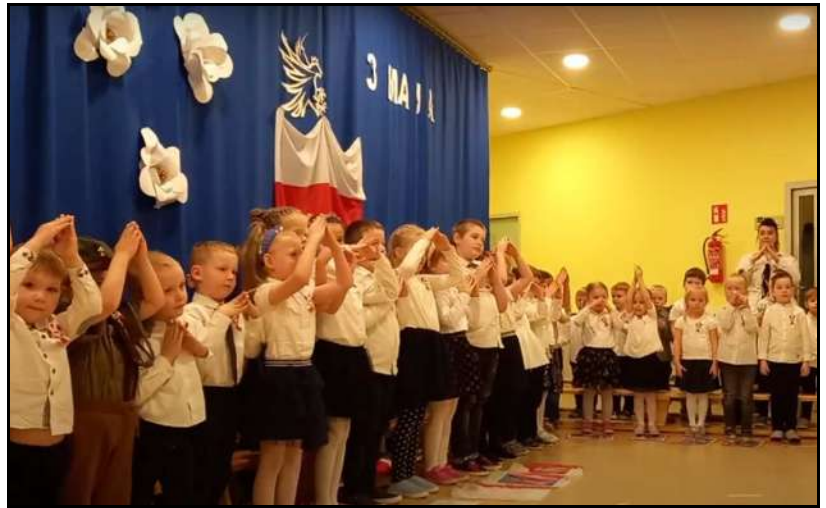
Akademia z okazji Święta 3 Maja