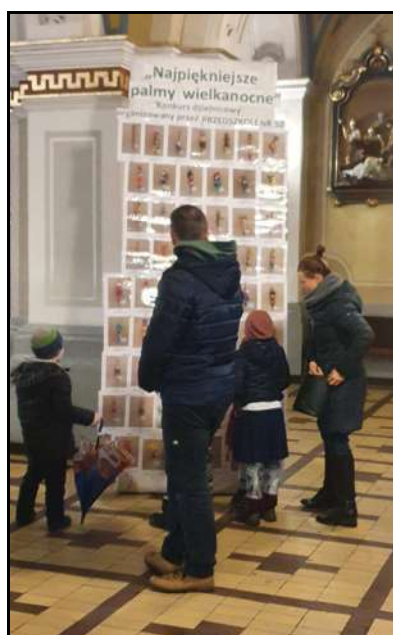
Konkurs na najpiękniejszą palmę wielkanocną zorganizowany przez Przedszkole nr 50 w Boguszowicach

Uroczystym rozpoczęciem Triduum Paschalnego była Msza Wieczery Pańskiej.