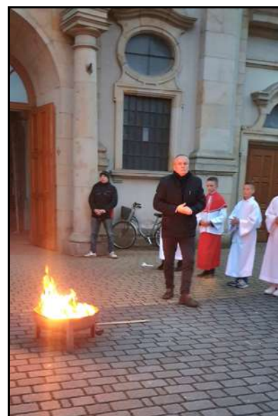
Rozpoczęcie liturgii Wigilii Paschalnej – poświęcenie ognia