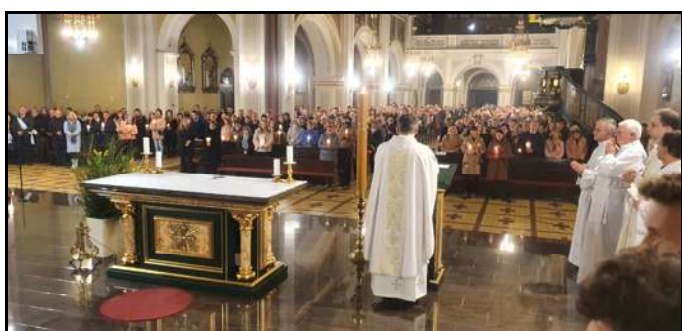
Exsultet – orędzie wielkanocne