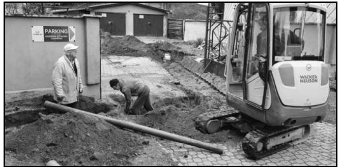
Położenie nowych rur kanalizacyjnych na Starej Farze