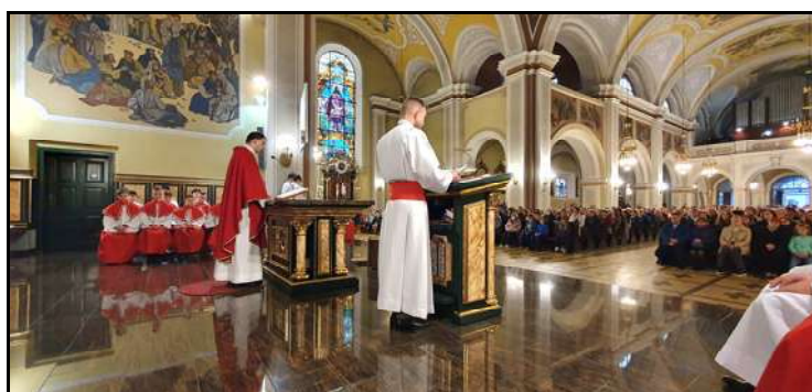
Liturgia słowa w Wielki Piątek