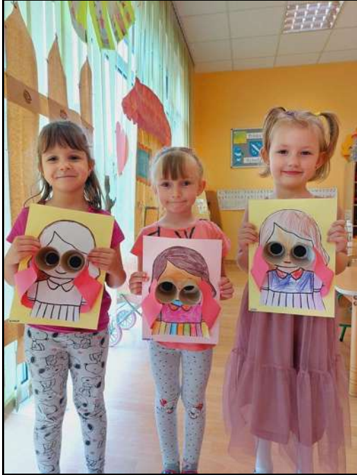
Wystawa prac przedszkolaków w Bibliotece Publicznej