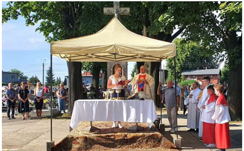
Zajęcia o Polsce w Przedszkolu nr 18 w Boguszowicach