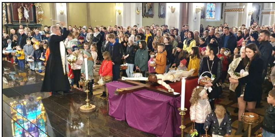
Święcenie pokarmów w Wielką Sobotę

W Wielką Sobotę adorowaliśmy Najświętszy Sakrament złożony w Grobie Pańskim. Tradycyjnie również święciliśmy pokarmy na stół wielkanocny. Zaś najważniejszym wydarzeniem zbawczym roku liturgicznego była liturgia Wigilii Paschalnej.