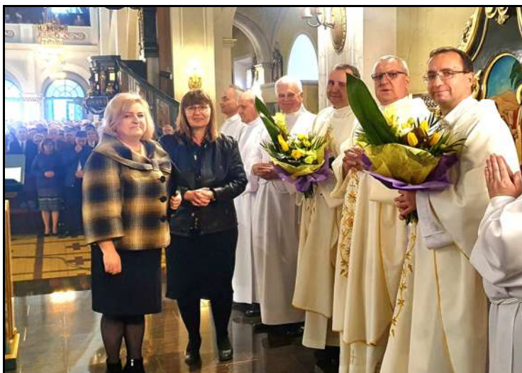
Życzenia kapłanom z okazji ich święta złożyli przedstawiciele Rady Parafialnej