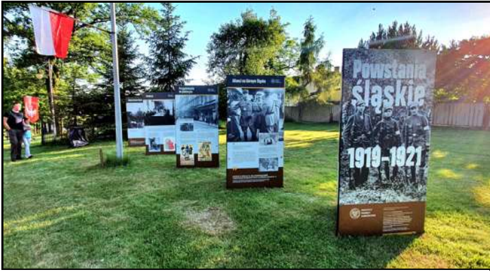
Festiwalowi towarzyszyła wystawa IPN „Powstania Śląskie 1919-1921”