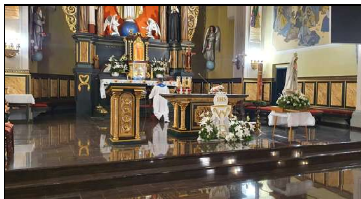
Czerwcowe Nabożeństwo Fatimskie