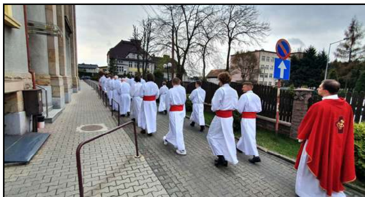
Procesja na wejście w Wielki Piątek