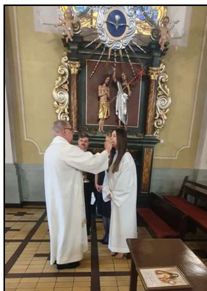
Przyjęcie Komunii Św.