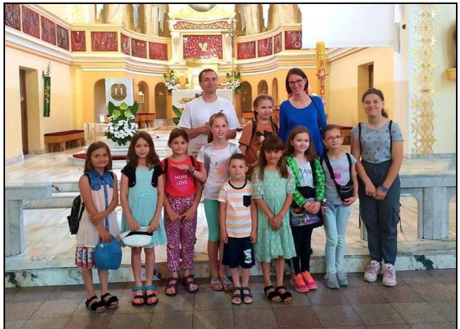
Dzieci Maryi na mini pielgrzymce do Sanktuarium w Turzy Śląskiej