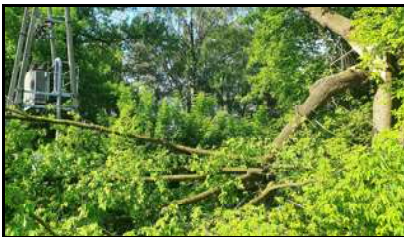
Polamane konary na parkingu kościelnym uszkodziły sieć energetyczną