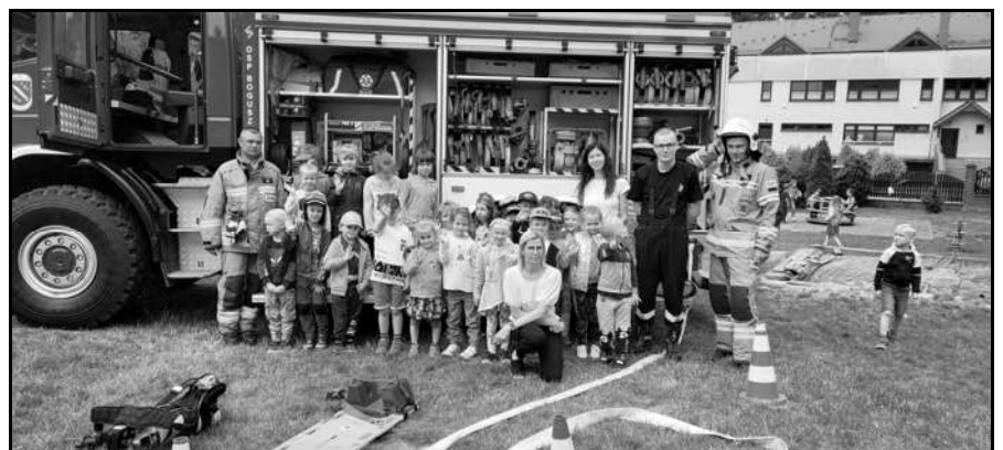
Wizyta strażaków z OSP Boguszowice

Maj był dla nas intensywnym miesiącem, lecz, gdy tylko europejska podróż dobiegła końca, rozpoczął się tydzień poznawania ciekawych zawodów w ramach doradztwa zawodowego w przedszkolu. Rozpoczęliśmy od dnia motoryzacyjnego i poznania zawodu mechanika. W naszym ogrodzie zaparkował traktor, dwa motory i wielki, biały pickup. Kolejnego dnia nasze przedszkole odwiedziła Strażacy z OSP Rybnika - Boguszowic. Dzięki ich uprzejmości, dzieci dowiedziały się jak wygląda ich praca od strony praktycznej. Przedszkolaki miały