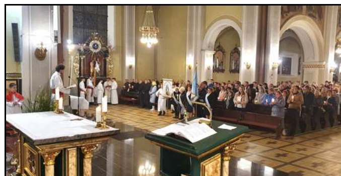
Liturgia chrzcielna – poświęcenie wody