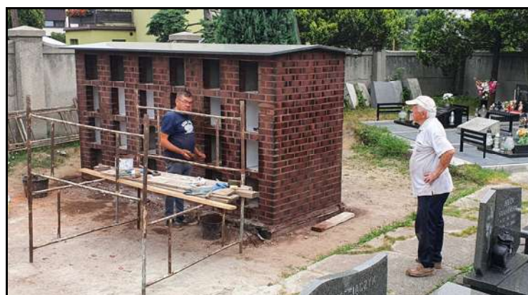
Pokrycie kolumbarium granitowym zadaszaniem