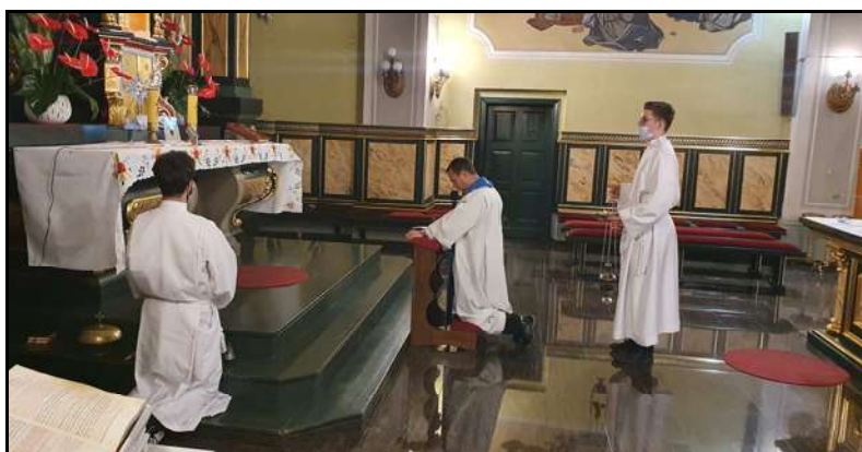
Czerwcowe Nabożeństwo Fatimskie