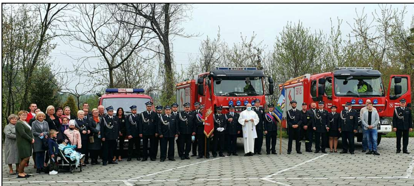
Wspólne zdjęcie strażaków z OSP Boguszowice i Gotartowice

1. maja o godz. 15.30 nasi strażacy wraz z rodzinami uczestniczyli we Mszy św. sprawowanej przez ks. Proboszcza w intencji żywych i zmarłych członków OSP Boguszowice i Gotartowice z okazji liturgicznego wspomnienia św. Floriana, które przypadało 4. maja.