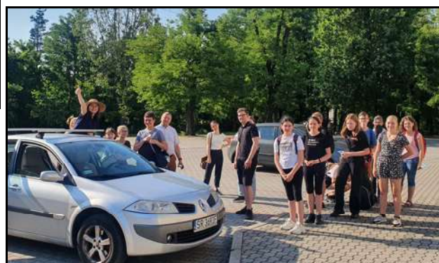
Spotkanie w formie wyjazdowej

W kolejne piątki po wieczornej Eucharystii miały miejsce spotkania formacyjne młodzieży oazowej.