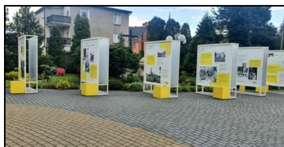
Prezentacja wystawy „Wstańcie, chodźmy...”