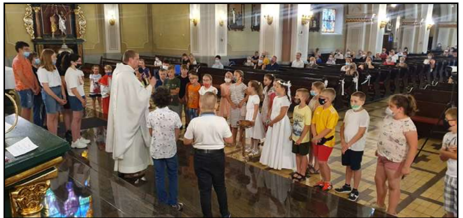
Eucharystia na zakończenie roku szkolnego