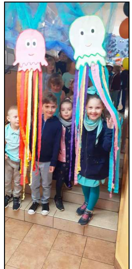
Obchody Dnia Dziecka