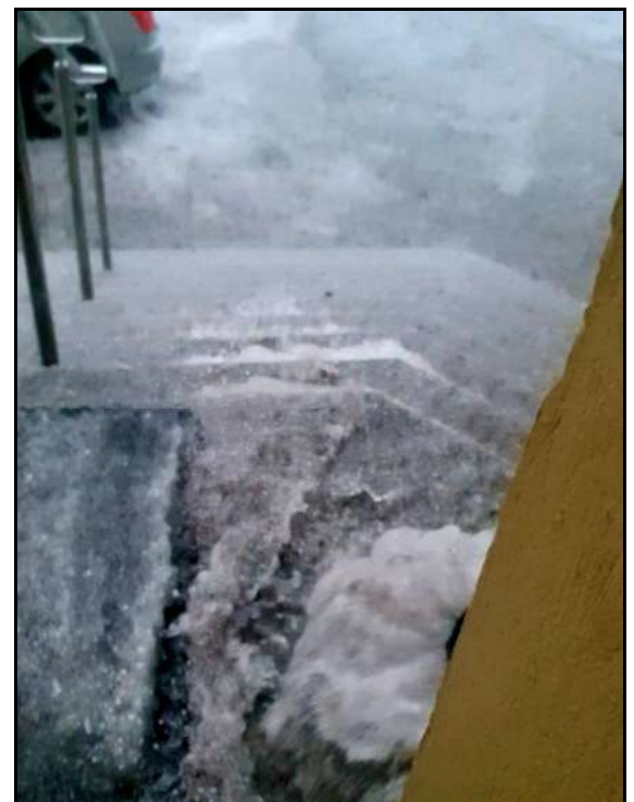
Schody do zakrystii po „gradzie”