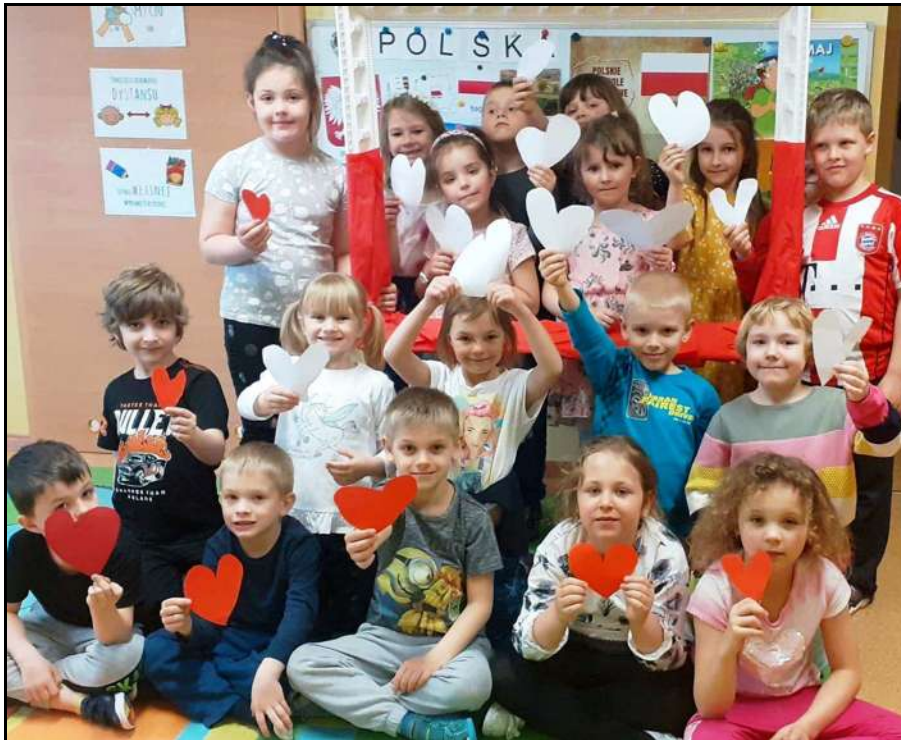
Zajęcia o Polsce w Przedszkolu nr 18 w Boguszowicach