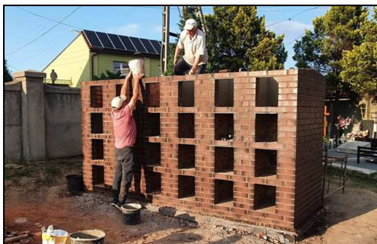
Prace murarskie przy kolumbarium