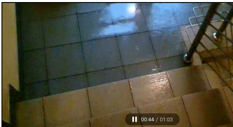
Zalanie klatki schodowej