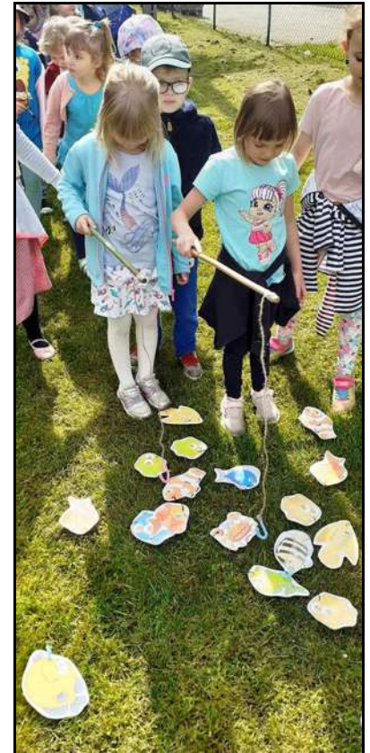
Obchody Dnia Dziecka