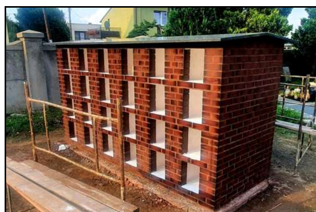
Zakończenie zasadniczego etapu budowy