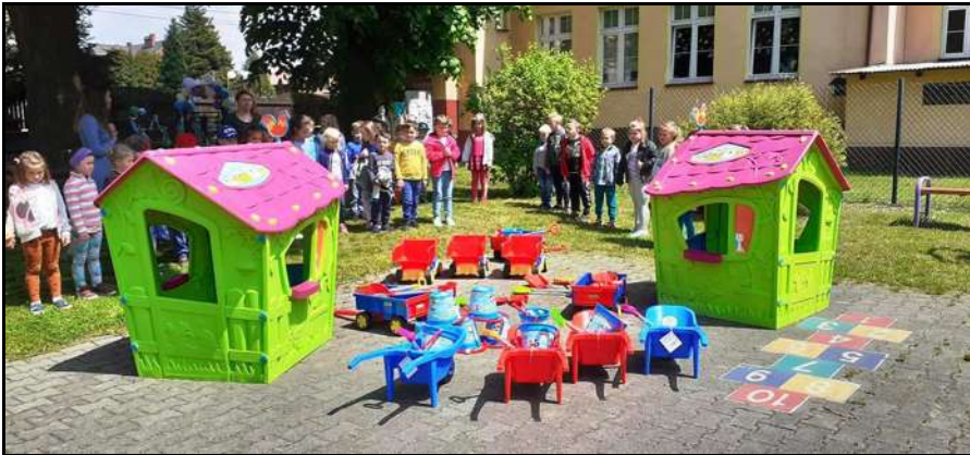
Obchody Dnia Dziecka