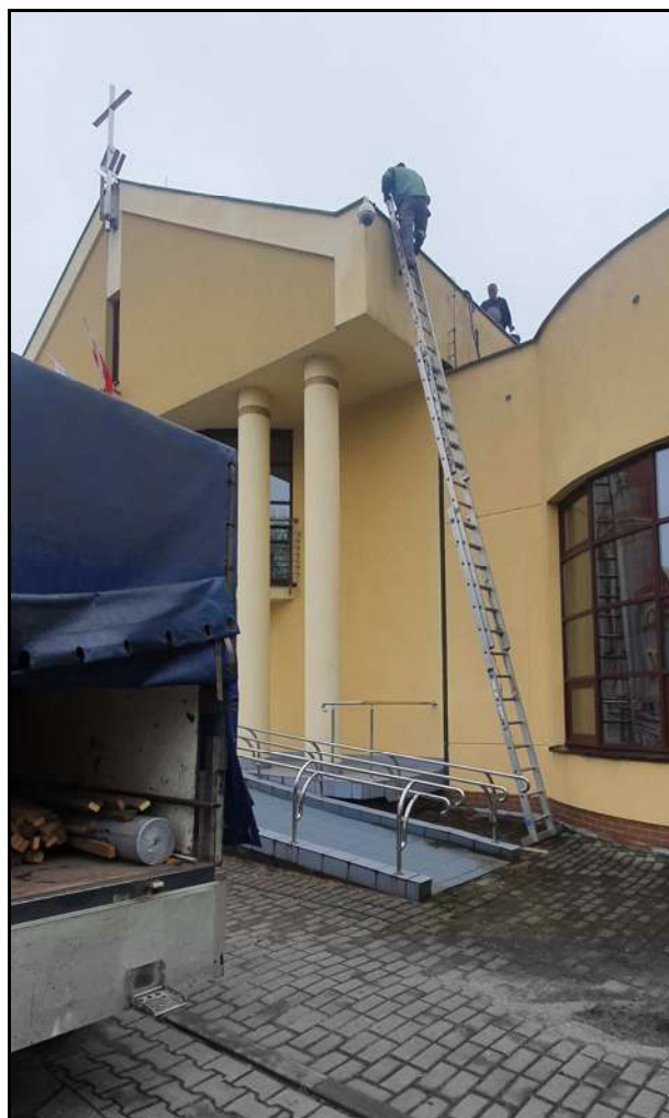
Naprawa dachu i czyszczenie rynien na Domu Parafialnym