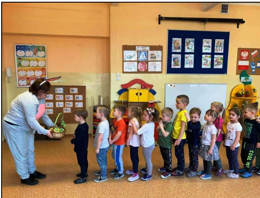
Wizyta zajaczka wielkanocnego