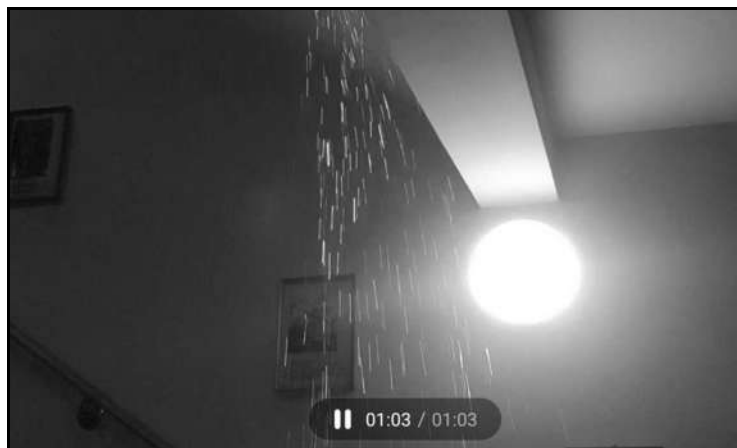
Wlewająca się woda na klatkę schodową